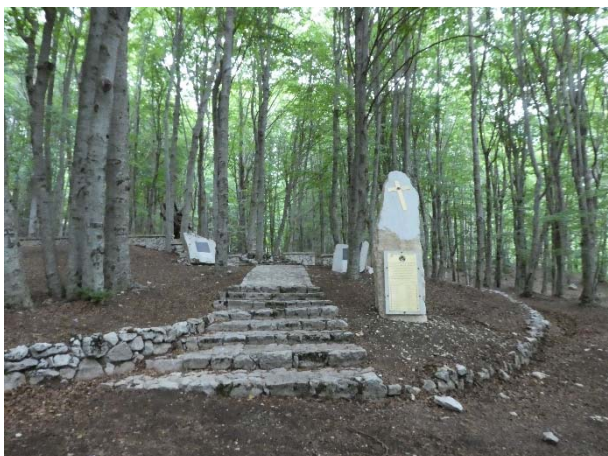
Sacrario di Collelungo

Dopo la sosta per il pranzo, si proseguirà lungo la cresta in direzione sud verso Monte Mare fino al valico di quota 1782 m, da cui verso sinistra si perderà rapidamente quota per ritornare nella Valle Venafrana e riprendere a ritroso il sentiero dell'andata. In un'ora circa si raggiungeranno le auto.