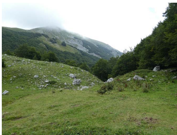
La Valle Venafrana