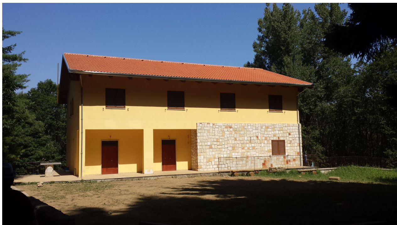
Rifugio Mafariello