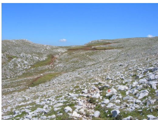
014 - il vallone Pratulungo