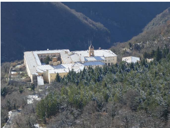
Certosa di Trisulti da Vado di Porca

L'unica nota dolente è l'Abbazia di Trisulti, adesso è diventata a pagamento, 5 euro e segue degli orari.