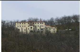
Santuario dei Lattani

mulattiera verso destra, proseguendo sulla stessa direzione di marcia. In circa 30 minuti, si raggiunge San Clemente di Galluccio, passando per il borgo de i Tirelli.