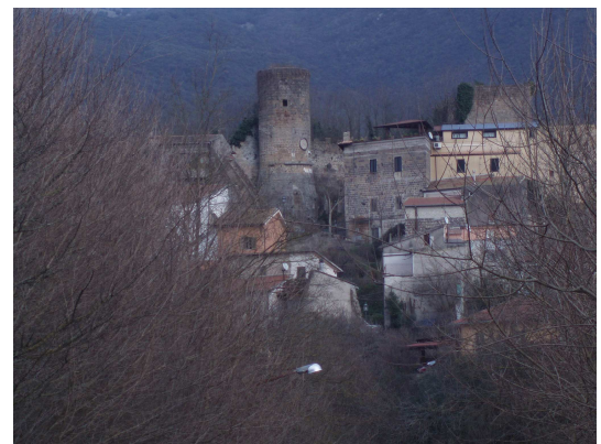
Mignano Monte Lungo da Porta Fratte

Dopo un po' di sterrato, purtroppo si riprende l'asfalto; nonostante ciò, la strada risulta piacevole, sia per l'assoluta assenza di auto, sia per il panorama che, man mano che si sale, si apre sulla cittadina di Mignano e sulle montagne circostanti.