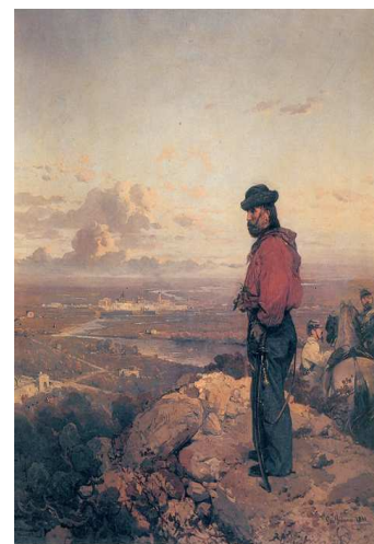
Garibaldi a Capua di G. Induno

Usciti dal cancello alto, alla destra della Fontana di Diana, si prosegue in leggera discesa su Via Maria Cristina di Savoia fino alla parte alta del borgo di San Leucio. Si prosegue a destra in salita sulla provinciale per Castel Morrone, per circa 500 metri; ad un cancello (200 m), poco dopo il curvone del ristorante Leucio, si prende a sinistra su uno sterrato che, in falsopiano, sovrastando il Real Sito del Belvedere e immerso nei profumi di mirto e corbezzolo, presenti in abbondanza, conduce al borgo della Vaccheria (191 m). Dopo la pizzata, prevista nei pressi della chiesa della Madonna delle Grazie della Vaccheria, si prosegue in discesa verso il portale d'ingresso del complesso monumentale; attraversata la S.S. Sannitica, voluta da Carlo III di Borbone, si segue per circa 50 metri a destra, fino ad imboccare a sinistra una strada asfaltata secondaria, che sale verso il Tifata. Alla prima biforcazione, si prosegue a destra su Via Ferdinando IV di Borbone: in leggera salita,