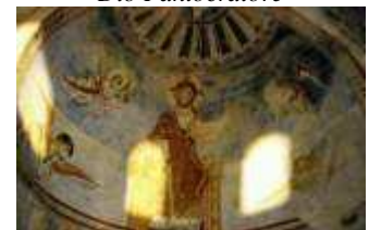
Basilica di S. Angelo in Formis