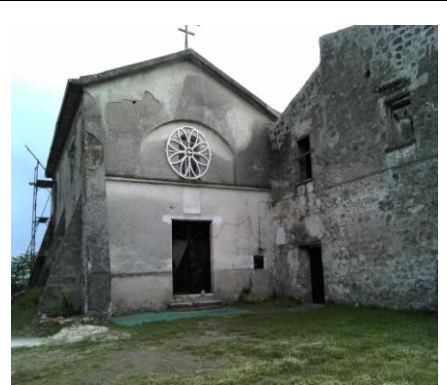
Santuario di Monte Lucno

ove nell'883 si rifugiarono i monaci dell'abbazia di Montecassino), che viene aggirato alla base del suo pendio occidentale. Raggiunto il borgo di Gloriani (299 m, frazione di Teano) si prosegue per un po' su strada asfaltata per riprendere subito una nuova carrareccia, che conduce ancora ad una strada asfaltata in prossimità del ristorante "Al vecchio mulino". Superatolo, dopo cento metri, ad una piccola cappella, si riprende una sterrata adiacente alla riva sinistra del fiume Savone. Si prosegue in leggera salita tra il Savone ed alcune località che si riportano in successione: Chiovari, S. Caterina e Capitolo (circa 550 m) tenendo a destra il monte Atano (623 m).