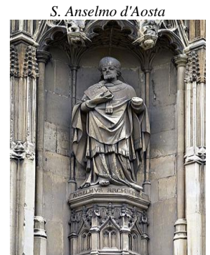
Cattedrale di Canterbury