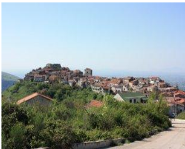
Rocchetta e Croce

Da qui, per il pianoro della Santella (614 m) ed un'antica mulattiera, si raggiunge la sede comunale di Rocchetta e Croce (450 m). Da Croce parte la mulattiera che porta all'eremo di S. Salvatore (857 m). In questo eremo, già Monastero di S. Salvatore de monte Caprario, dipendenza dell'abbazia di San Salvatore Telesino, nel 1089, si fermò Sant'Anselmo d'Aosta, abate di Bec (Normandia) e arcivescovo di Canterbury; qui, scrisse una delle sue opere più importanti, il Cur Deus Homo.