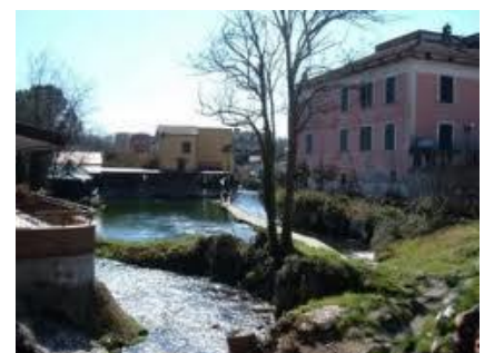
Triflisco, frazione di Bellona

Dalla chiesetta, in leggera salita e lasciando a destra una grossa cava, si prende una carrareccia che, attraversando il bosco di San Vito, sempre alle falde della Collina di S. Iorio, raggiunge uno spiazzo, con al centro una vecchia quercia – ormai morta, nera come 'a morte –, e subito dopo una sorgente. Si prosegue a sinistra in discesa su una strada asfaltata abbastanza rovinata fino a sbucare sulla Strada Provinciale 4 (Santa Maria Capua Vetere, dove prende il nome di Via Galatina - salita dei Gradilli). Si svolta a sinistra e dopo un centinaio di metri si raggiunge il Ponte Annibale, sul fiume Volturno, che va attraversato.