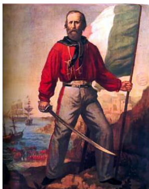
Giuseppe Garibaldi di Anonimo

Dislivello in salita: 250 m; Distanza: Km 13,500; Tempo di cammino: h 4:30; Quota massima: 240 m