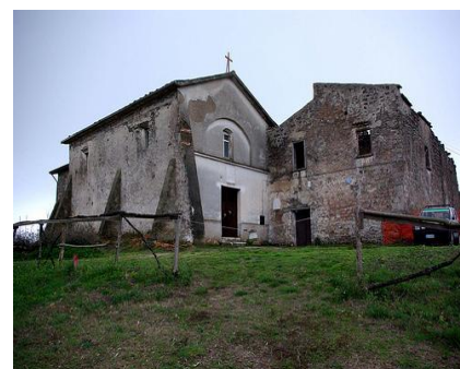
Santuario di Monte Lucno

Raggiunto il borgo di Gloriani (299 m, frazione di Teano) si prosegue per un po' su strada asfaltata per riprendere subito una nuova carrareccia, che conduce ancora ad una strada asfaltata in prossimità del ristorante "Al vecchio mulino". Superatolo, dopo cento metri, ad una piccola cappella, si riprende una sterrata adiacente alla riva sinistra del fiume Savone. Si prosegue in leggera salita tra il Savone ed alcune località che si riportano in