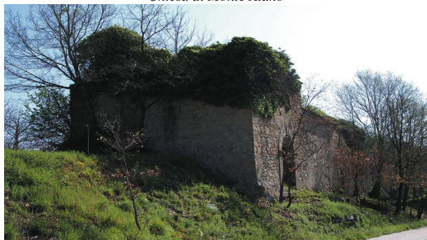
Chiesa di Monte Atano

successione: Chiovari, S. Caterina e Capitolo (circa 550 m) tenendo a destra il monte Atano (623 m).