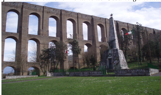
Valle di Maddaloni

Acquedotto Carolino e Monumento-Ossario garibaldino