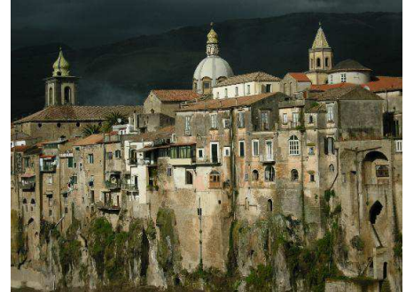
Veduta di Sant'Agata dei Goti

all'ingresso del ristorante con cucina valdostana: La Baita, su larga strada panoramica sui Ponti della Valle, opera del Vanvitelli, e più avanti sulla Torre superiore del castello dei Carafa di Maddaloni e sulla punta San Michele con omonimo Santuario, che si trova al culmine della scalinata che sale dal centro di Maddaloni, sfiorando il castello. Giunti all'Oasi di preghiera dedicata a San Pio da Pietrelcina (233 m – Km 0,840 dalla partenza), si lascia la strada asfaltata; essa prosegue fino a Caserta Vecchia passando per Casola ancora per un tratto bianca, ma a quanto pare