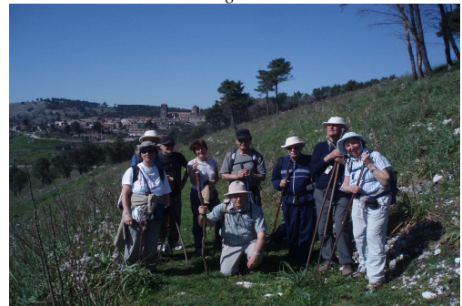
Escursionisti al Borgo di Caserta Vecchia

ma anche verso sinistra di prendere una carrareccia, che con pochi tornanti consente di scendere a Caserta passando per San Pietro ad Montes; 2) la seconda, sempre a sinistra , appena sopra la precedente, da cui piano piano diverge in salita, che consente di raggiungere velocemente la piazza della cattedrale (406 m - Km 7,020 dalla partenza); 3) proseguendo dritto, in una traccia nella pineta, si raggiunge il castello e da qui si può proseguire per il centro del borgo, passando anche davanti alla Chiesa dell'Annunziata; 4) la strada a destra conduce alla chiesetta di San Rocco (372 m - Km 7,500 dalla partenza - circa ore 2:30 dalla partenza ), dove è la zona dei parcheggi.